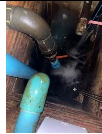
รูปภาพ : ตรวจสอบรอยรั่วของท่อจ่ายน้ำ บริเวณรอยต่อและปั๊มสูบน้ำ เพื่อลดการสูญเสียการใช้น้ำ