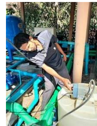
รูปภาพ : ตรวจสอบเครื่องแยกริ้ว ปริมาณการตกตะกอนภายในถังเก็บน้ำใต้ดินโครงการ